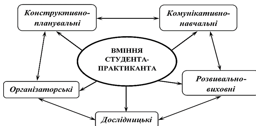
Рис. 1. Уміння студента-практиканта, необхідні для проходження навчальної педагогічної практики

У програмі навчальної педагогічної практики чітко окреслено, що «студент-практикант повинен володіти такими вміннями (Рис. 1): конструктивно-планувальними, комунікативно-навчальними, організаторськими, розвивально-виховними, дослідницькими» [10, с. 7–8], які між собою взаємопов'язані.